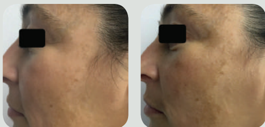
אחרי 2 טיפולים