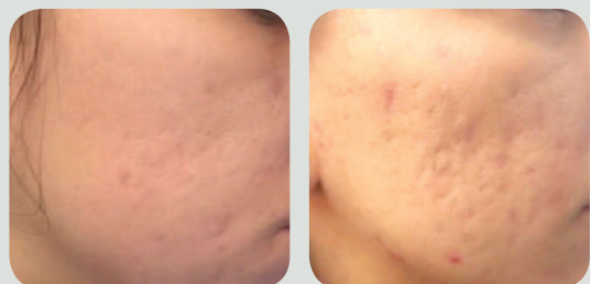
אחרי 5 טיפולים