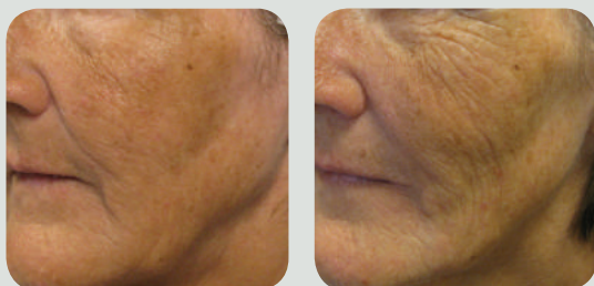
אחרי 4 טיפולים