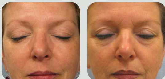
אחרי 4 טיפולים